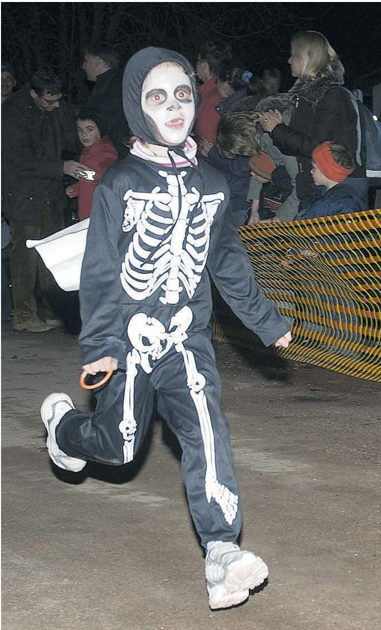
Läufer sind durchtrainiert und durchweg sehr dünn. Beim Halloween-Lauf in Oppen laufen aber auch echte Skelette.